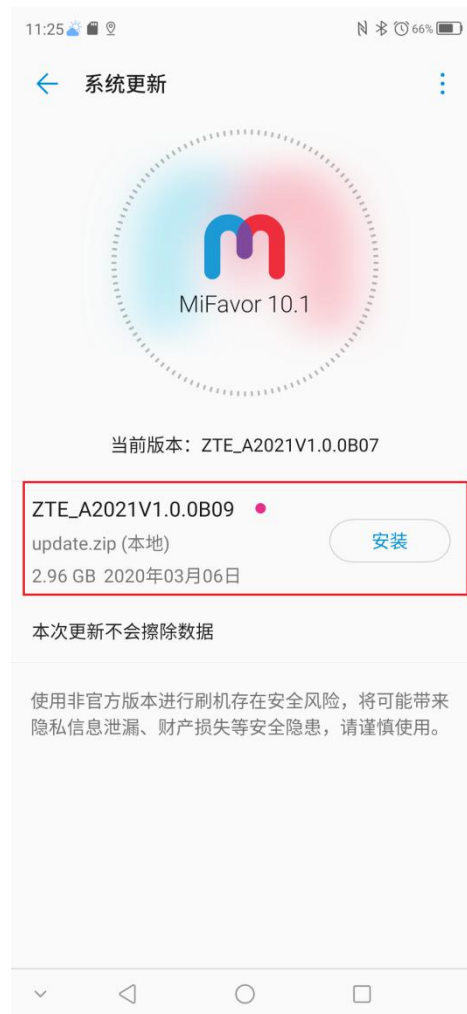
图 3-1 SDcardUpdate 界面